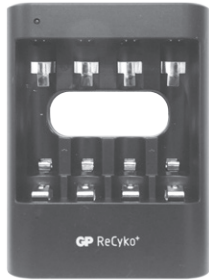
GP PowerBank Charger